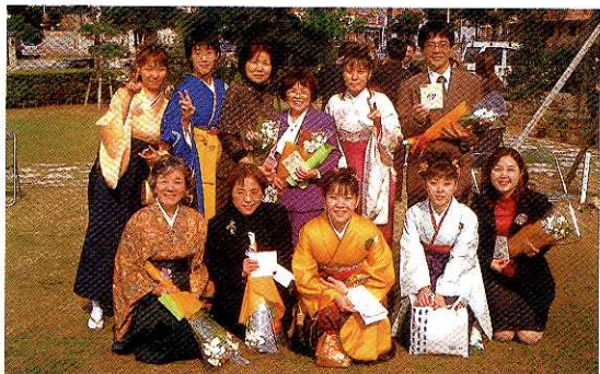
一期生の卒研究生と卒業式の日に。