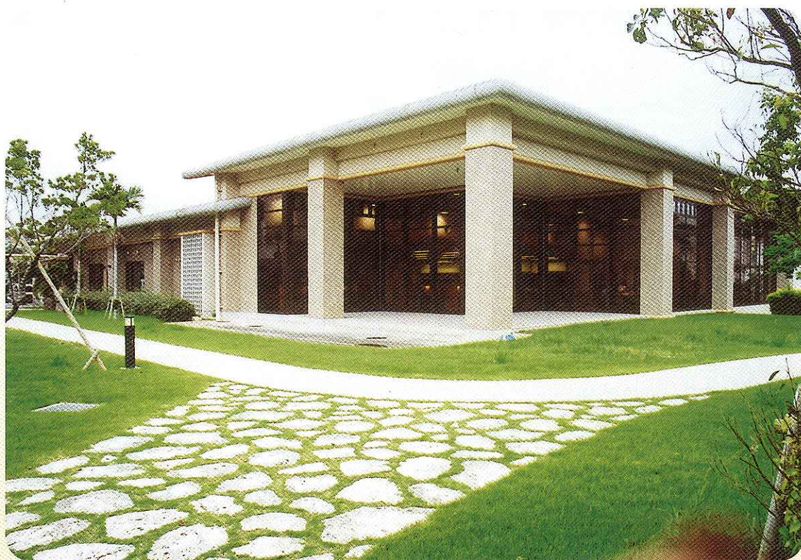
中庭から望む附属図書館